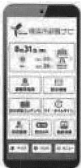
アプリのイメージ